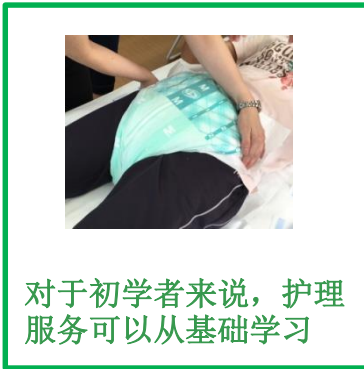
对于初学者来说，护理服务可以从基础学习