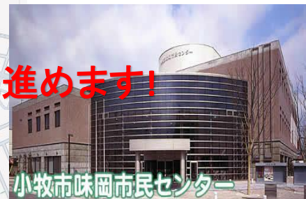
小牧市味岡市民センター

*実務者研修に期限はありません 一度受ければ、ずっと有効資格です *いつでも受けられます